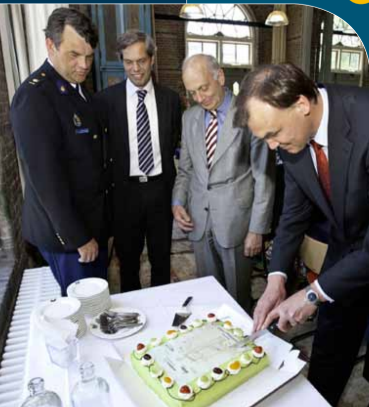
Feestelijke bijeenkomst na ondertekening convenant

Het Regionaal Coördinatiecentrum (RCC) heeft in 2009 vooral in het teken gestaan van actualisatie en investering in diverse ontwikkelingen, zowel fysiek in inrichting en apparatuur, als ook in de ontwikkelingen van protocollen en handboeken.