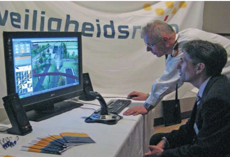
INFORMATIEBIJENKOMST NIEUWE COLLEGELEDEN